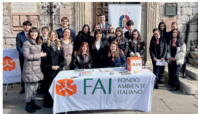
Sul campo Gli studenti dell'Alberghiero di Assisi sono precursori dei tempi futuri

NASCONO LE NUOVE FIGURE DEL TURISMO: OLTRE LA TRADIZIONE Dalla sala alla guida, dall'accoglienza alla progettazione di itinerari: l'Alberghiero di Assisi lavora su profili che vanno oltre le mansioni tradizionali. Tra le figure su cui si concentra la formazione ci sono: guide enogastronomiche, comunicano cultura del cibo e del vino, in italiano e in inglese, a un pubblico internazionale sempre più attento. Apprendisti Ciceroni ed esperti di accoglienza territoriale: diventano "ambasciatori"