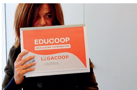
Studenti protagonisti Ai Molini Popolari Riuniti sono di casa