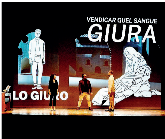
Studenti Ancora una volta protagonisti, la rappresentazione a Todi

Nasce dall’idea di portare per la prima volta l’opera lirica dentro la scuola in modo diretto e coinvolgente, trasformandola in un’esperienza di grande valore formativo e culturale.