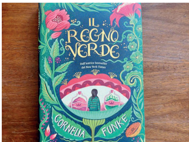
La copertina Il libro porta la firma di Cornelia Funke

IL REGNO VERDE di Cornelia Funke, Giunti Editore (19,90 euro). La pluripremiata autrice torna con una storia sulla natura, l'ambiente, i fiori, i frutti e il mondo meraviglioso che ci circonda. Un amore immenso, che ci respira vicino ma che, a volte, non riusciamo a vedere. Caspia si è appena trasferita a Brooklyn per le vacanze estive, quando nella nuova casa si