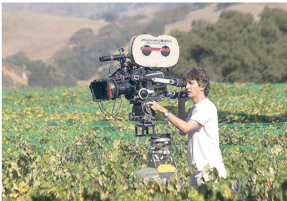
Seven Un film che è punto di seria riflessione e non soltanto per gli studenti

■ Cosa spinge un uomo a voler strappare via dal peccatore il proprio peccato? Il film "Seven" del regista David Fincher, ruota intorno a questo interrogativo straziante, la cui risposta diventa una profonda e assillante necessità di vita. Il protagonista John Doe, nonché l'assassino, viene presentato sul grande schermo in maniera del tutto innovativa rispetto alla tradizione del film horror-giallo. L'aspetto più interessante è che siamo di fronte a un assassino-lettrato, che trasforma i propri crimini in atti di riscatto sociale, e al tempo stesso, trovando nelle proprie atrocità compiute, un significato esistenziale e perfino poetico. Ogni morte è associata a un peccato capitale. Nessuna è per caso, ma è studiata in modo maniacale e talmente complesso, da lasciare sconvolto qualunque investigatore. John Doe è sceso sulla terra come se fosse un profeta, o almeno lui stesso si descrive così, per insegnare agli uomini a vivere onestamente e a liberarsi delle colpe primordiali che affliggono la società borghese. L'aspetto religioso, però, è relativamente importante, infatti non agisce mai in nome di un Dio, ma di un potere superiore: la forza della vendetta che spinge a cercare la verità e l'origine di ogni cosa. Non è un assassino che colpisce per un tornaconto personale, ma per un atto di rivoluzione e di protesta che riguarda l'intera umanità. John Doe è in