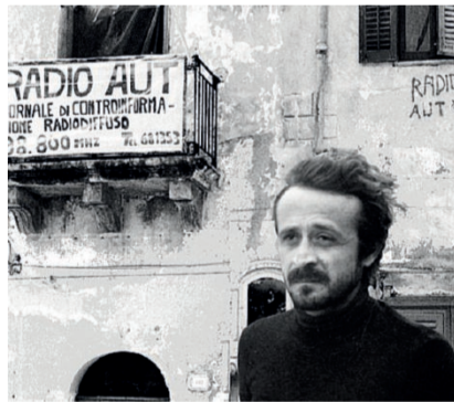
Peppino Impastato Dietro la sua creatura Radio Aut

DON PINO PUGLISI, IL "ROMPISCATOLE" DI BRANCACCIO Questo soprannome gli fu dato dai suoi alunni che, alla prima lezione, rimasero colpiti dal suo particolare approccio; portò, infatti, una scatola di cartone che, a fine lezione calpestò, per far capire ai ragazzi che dovevano opporsi alle ingiustizie: dovevano essere dei "rompiscatole".