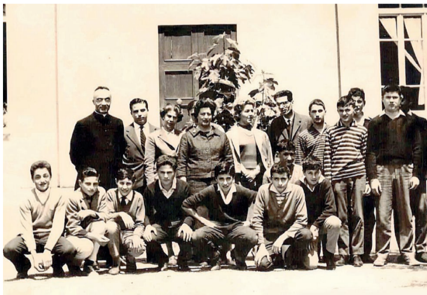
F.F. Anno scolastico 1960-61 La III° A della media Brunone Moneta di Marsciano

Chi è in possesso di vecchie foto e vuole vederle pubblicate può farlo e la modalità è semplicissima. Basta spedirle a scuola@gruppocorriere.it specificando il nome dell'istituto, la città, la sezione e l'anno scolastico. Naturalmente se ci sono, molto graditi anche i nomi dei protagonisti e degli insegnanti del tempo.