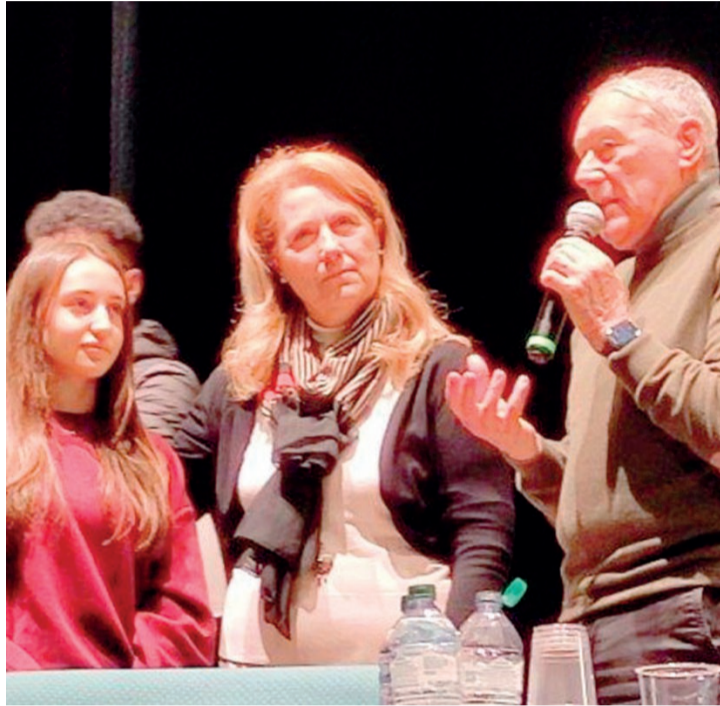
Sul palco L'ex presidente del Senato, Piero Grasso

zione letale da un medico corrotto dalla mafia affinché il giovane fosse messo a tacere per sempre.