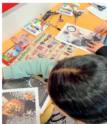
Mostra Cresce l'attesa