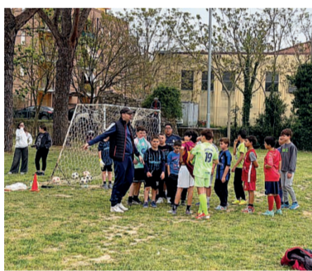
Che festa In tanti per brindare alla scuola elementare IV Novembre

ti. In ogni angolo un nugolo di scolari a giocare sotto l'occhio vigile degli istruttori. L'associazione Rione Ponte Aps ha fatto in modo che tut-