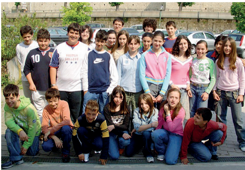
F.F. Todi E' l'anno scolastico 2006, in evidenza la II° F della scuola media Cocchi Aosta

Chi è in possesso di vecchie foto e vuole vederle pubblicate può farlo e la modalità è semplicissima. Basta spedirle a scuola@gruppocorriere.it specificando il nome dell'istituto, la città, la sezione e l'anno scolastico. Naturalmente se ci sono, molto graditi anche i nomi dei protagonisti e degli insegnanti del tempo.