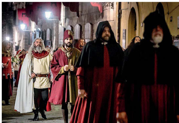
Il corteo storico Riproporrà la processione del 1371 in onore di San Giovenale

La sera antecedente la Corsa all'Anello, sabato 9 maggio, a partire dalle 21 si svolgerà per le vie del centro il grande corteo storico, considerato uno dei più belli d'Italia sia per il suo impatto visivo che per la ricerca storica condotta sugli abiti, filologicamente attinenti all'epoca. La sfilata conterà come di consueto la presenza di più di settecento figuranti e riproporrà per tradizione la processione in onore del patrono San Giovenale del 1371.