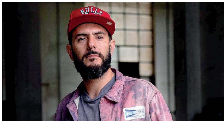
Cristiano Carotti. È lui l'autore del Bravio 2026. La spiegazione dell'opera: una forza indomita che si sprigiona

■ Non solo premio, ma opera che si fa spazio e racconto: il Bravio della 58esima edizione della Corsa all'Anello (premio per il miglior terzere) si trasforma in un dispositivo installativo capace di coinvolgere lo spettatore. A firmarlo è Cristiano Carotti, che con "L'anno del cavallo di fuoco" supera la dimensione tradizionale del riconoscimento per dare vita a un progetto complesso e stratificato. Il Bravio diventa per la prima volta elemento scultoreo autonomo, inserito in un "corpus installativo" che dialoga con gli spazi del Palazzo dei Priori. Al centro, il cavallo di fuoco: archetipo di energia vitale e trasformazione, simbolo di uno